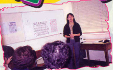
99年11月 家長教師會舉辦「情緒及壓力處理」家長座談會