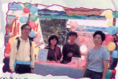
99年11月 閱讀嘉年華之示範攤位