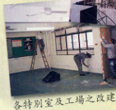
各特別室及工場之改建