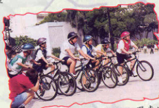
2000年2月 學生參加醒目仔單車比賽