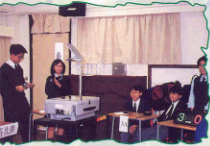
99年12月 中文週常識問答比賽