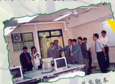
99年6月 校董巡校，並參觀本校新設之多媒体語言實驗室