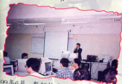
99年6月 教師接受語言實驗室的操作訓練