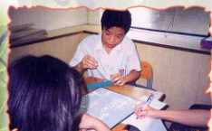
99年5月 中文砌字遊戲比賽