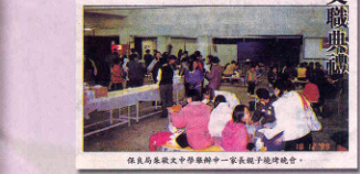
校長與各級中學教師辦中一家長教師聯誼會。

"I believe everyone possesses a dignity that one deserves to be blessed and proud of even though they may shine in different aspects." The school's cycling, football and handball teams have achieved many great accomplishments in inter-school competitions. The students' enthusiasm for social services has won the school the Po Leung Kuk Ping Pong Raising Day championship over three consecutive years. In recalling his years with the school since 1994, Mr Chan is most delighted to see the changes undergone by the students. "I have witnessed the power of sports in correcting the students' behavioural problems," he said. "I am so glad to see that some students have become more self-disciplined in school under the influence of the coach's strict disciplinary requirements in training." The sense of achievement from extracurricular activities to work harder at their studies. "When I first came to the school, I knew that our students were generally less interested and motivated in their studies."