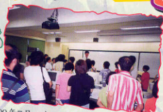
99年7月 中一新生家長參觀本校的資訊科技設備