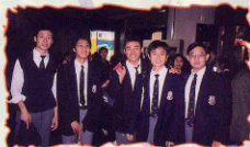
2000年2月 中六學生參觀教育及職業博覽