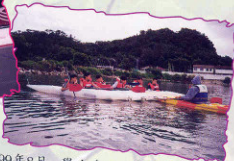
99年8月 學生參與獨木舟訓練