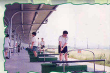
99年8月 學生參與高爾夫球訓練