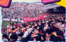
99年10月 保良局「愛心大踏步」慈善步行