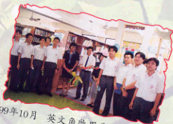
99年10月 英文角啟用典禮