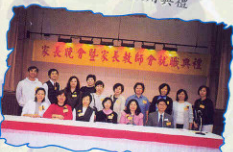
99年11月 家長晚會暨家長教師會就職典禮