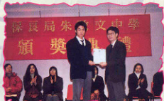
2000年1月 第一學期頒獎典禮