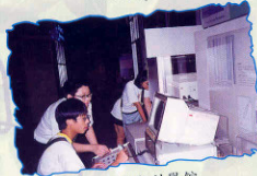
99年7月 學生參觀科學館