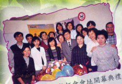
99年5月 家長教師會會址開幕典禮