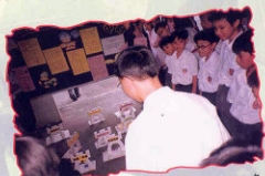
99年9月 「積極人生邁向千禧」多元智能遊戲