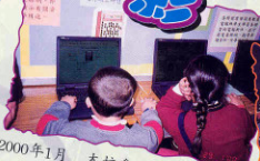
2000年1月 本校參加沙田區中學巡禮，小學生正透過電腦瀏覽本校網頁