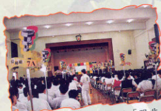
99年10月 赫壘坊劇場表演「服非估」話劇