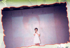
99年7月 試後活動——卡拉OK比賽