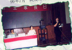
99年7月 中一新生家長日