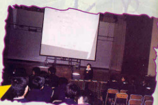
2000年2月 中五及中六學生參加就業及升學講座